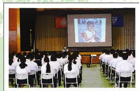
県立岩瀬農業高等学校

令和4年度「大切な命を守る」全国中学・高校作文コンクールにおいて受賞した作文を、次ページに掲載しております。