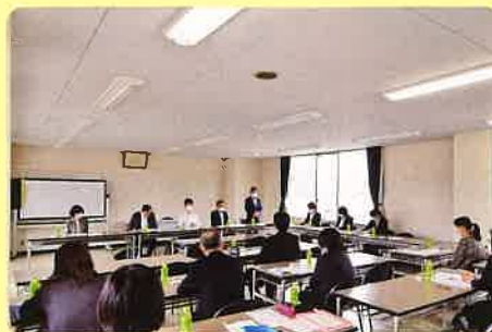
▲インテーク会議の様子