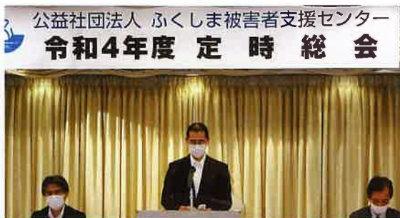
福島県警察本部長 児嶋氏挨拶