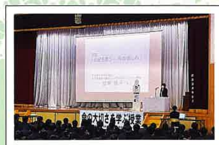
県立岩瀬農業高等学校

令和3年度「大切な命を守る」全国中学・高校作文コンクールにおいて受賞した作文を、次ページに掲載しております。