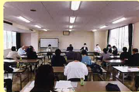
▲インテーク会議の様子