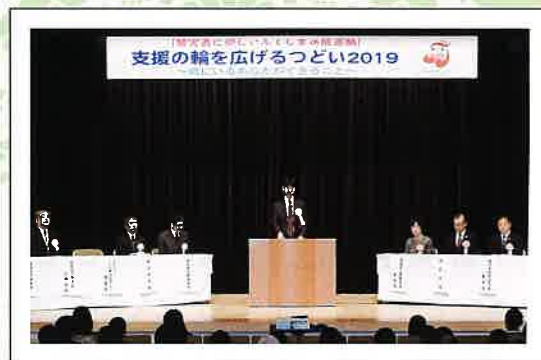
センター副理事長挨拶

犯罪被害者の悲しみ・苦しみと向き合い、葛藤の中で「生き直し」をした経験について話しをされました。