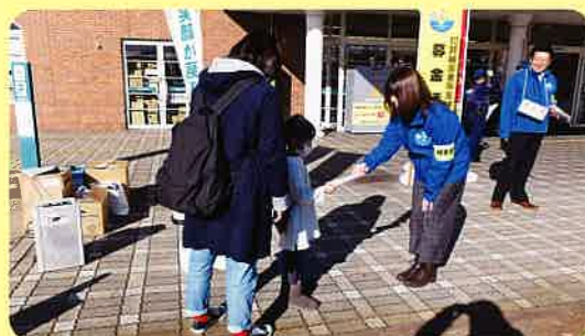
会津若松市(リオンドール会津アピオ店前)