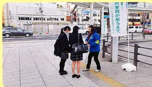
いわき市(JRいわき駅南口駅前広場)

【支援員さんから一言】 ～全国被害者支援フォーラム2019に参加した支援員さんから感想を伺いました～ 今回の研修を通して被害に遭った子どもたちへの中長期的支援のための連携として社会で支える体制作りが大切であり、それぞれの事例への引継ぎが重要であることを学んだ。