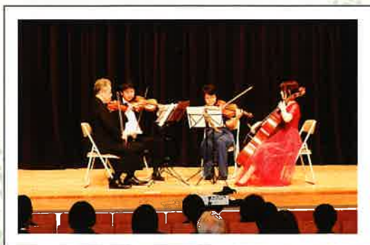
支援コンサートの様子

第三部の支援ミニコンサートでは、「弦楽四重奏団 TOHOカルテット」のメンバーが心に響く演奏を披露されました。