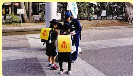
福島市(JR福島駅東口広場)

当センターでは、11月25日(月)から12月1日(日)の「犯罪被害者週間」に合わせて、福島市・会津若松市・郡山市・いわき市において街頭広報・募金活動を行い、悲惨な事故や犯罪の被害者への支援には、理解と協力が必要と訴え、募金を呼びかけました。