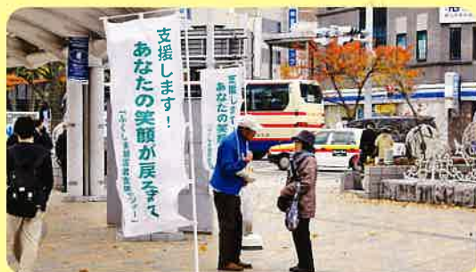
郡山市(JR郡山駅西口中央広場)